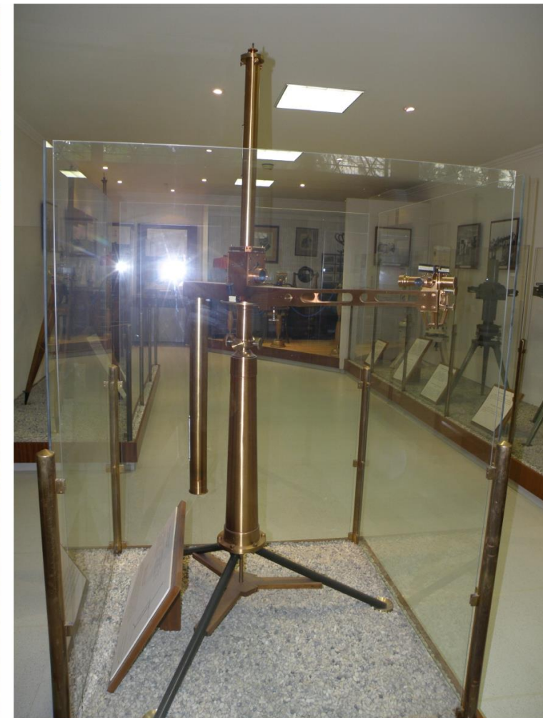
Obr. 5 Přístrojová technika vystavená v muzeu R. Eötvöse