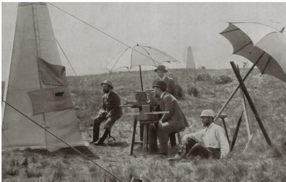
Obr. 3 Příklad fotografické dokumentace z měření R. Eötvöse

1916: Field survey at Gbely (Egbell). Birth of hydrocarbon research geophysics