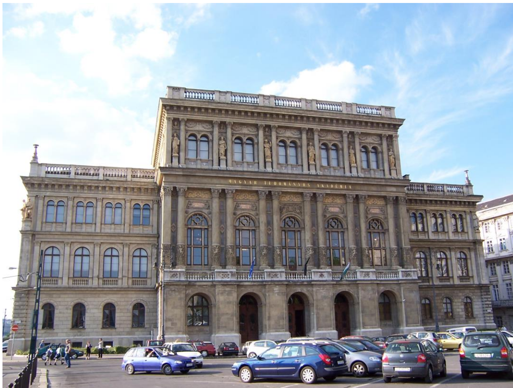
Obr. 2 Historická budova Maďarské akademie věd https://enacademic.com/pictures/enwiki/66/Budapest_Hungarian_Academy_of_Sciences.jpg

Osobně jsem měl čest zúčastnit se 8. 4. 2019 v historické budově Maďarské akademie věd (obr. 2) uvedeného Pamětního dne. Program zasedání je zřejmý z úvodního obrázku. Zasedání se zúčastnila řada velmi významných hostů, což je patrné z patronů akce a přednášejících během hlavního zasedání (viz obr. 1). U příležitosti uvedeného výročí byla mj. představena řada fotografií (příklad na obr. 3), výroční známka (obr. 4) a rekonstrukce přístrojové techniky (obr. 5).