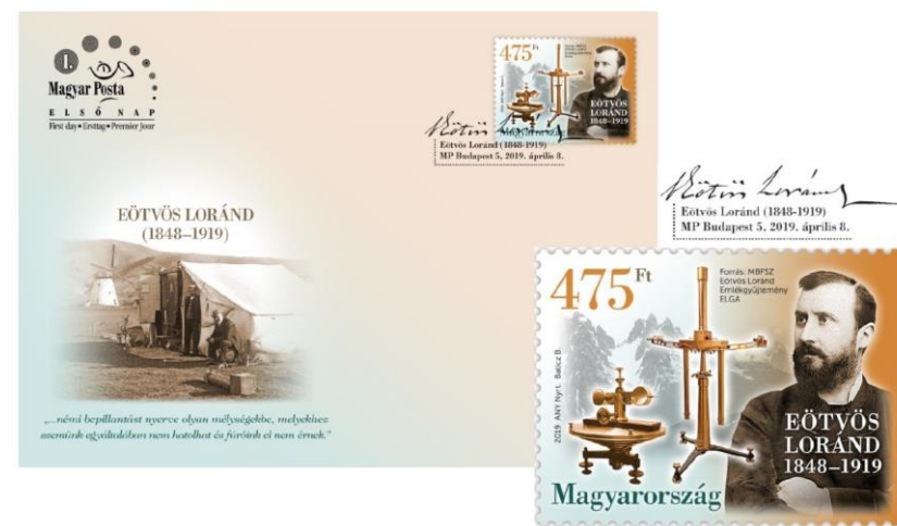
Obr. 4 Obálka prvního dne a poštovní známka připomínající výročí úmrtí R. Eötvöse ( https://www.posta.hu/stamps/stamps/new-stamps/famous-hungarians-roland-eotvos-2019 )